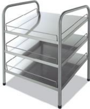
Distribución y exposición de alimentos - Self-service - Elementos neutros