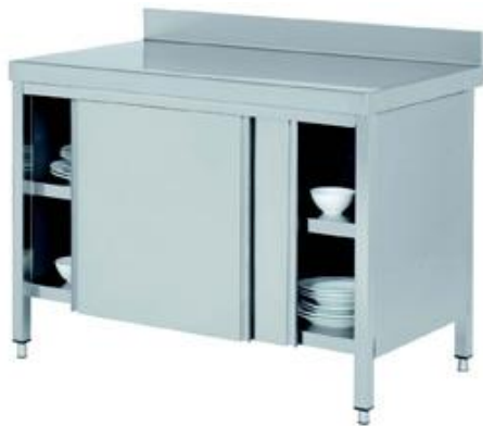
Preparación estática - Mesas de trabajo - Mesas de trabajo murales y centrales - Murales con puertas