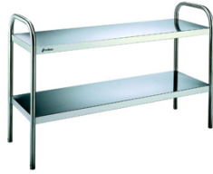
Esteras sobremesa Neutras