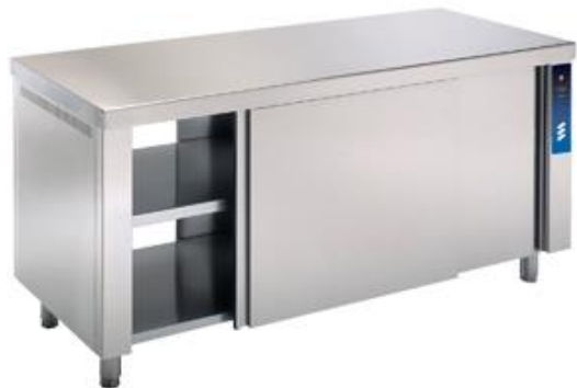
Preparación estática - Mesas de trabajo - Mesas calientes - Pasantes