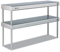
Esteras sobremesa Con luz y calor