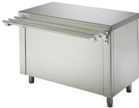
Distribución y exposición de alimentos - Self-service - Mesas calientes