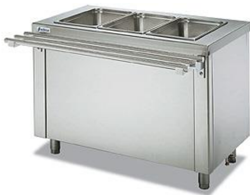
Distribución y exposición de alimentos - Self-service - Muebles baño María - Muebles baño María seco - con y sin reserva