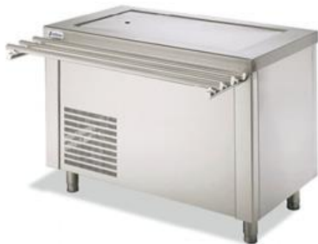
Distribución y exposición de alimentos - Self-service - Muebles con placa fría superior