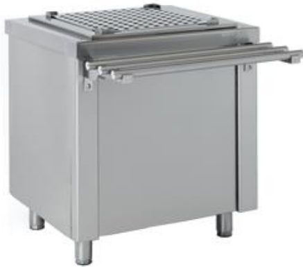
Distribución y exposición de alimentos - Self-service - Elementos neutros