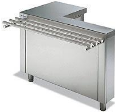
Distribución y exposición de alimentos - Self-service - Elementos neutros